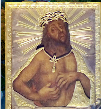
OBRAZ CHRYSZTUSA MIŁOSIERNEGO Z TARNORUDYNA WOLYNIU W KOŚCIELE W ZIELONCE PASŁĘCKIEJ