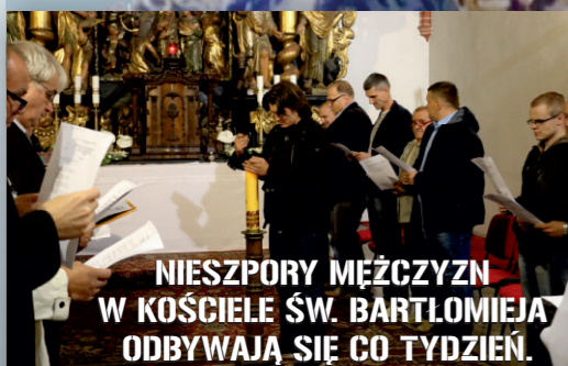
NIESZPORY MĘŻCZYZN W KOŚCIELE ŚW. BARTŁOMIEJA ODBYWAJĄ SIĘ CO TYDZIEŃ. Podobna modlitwa mężczyzn ma miejsce w kościele Miłosierdzia Bożego w Elblągu.