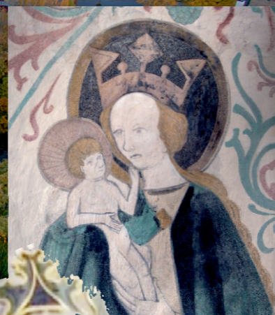
GOTYCKIE FRESKI Z KOŚCIOŁA W MARIANCE K. PASŁĘKA (XIV W.) Odkryte i odrestaurowane w ostatnich latach.