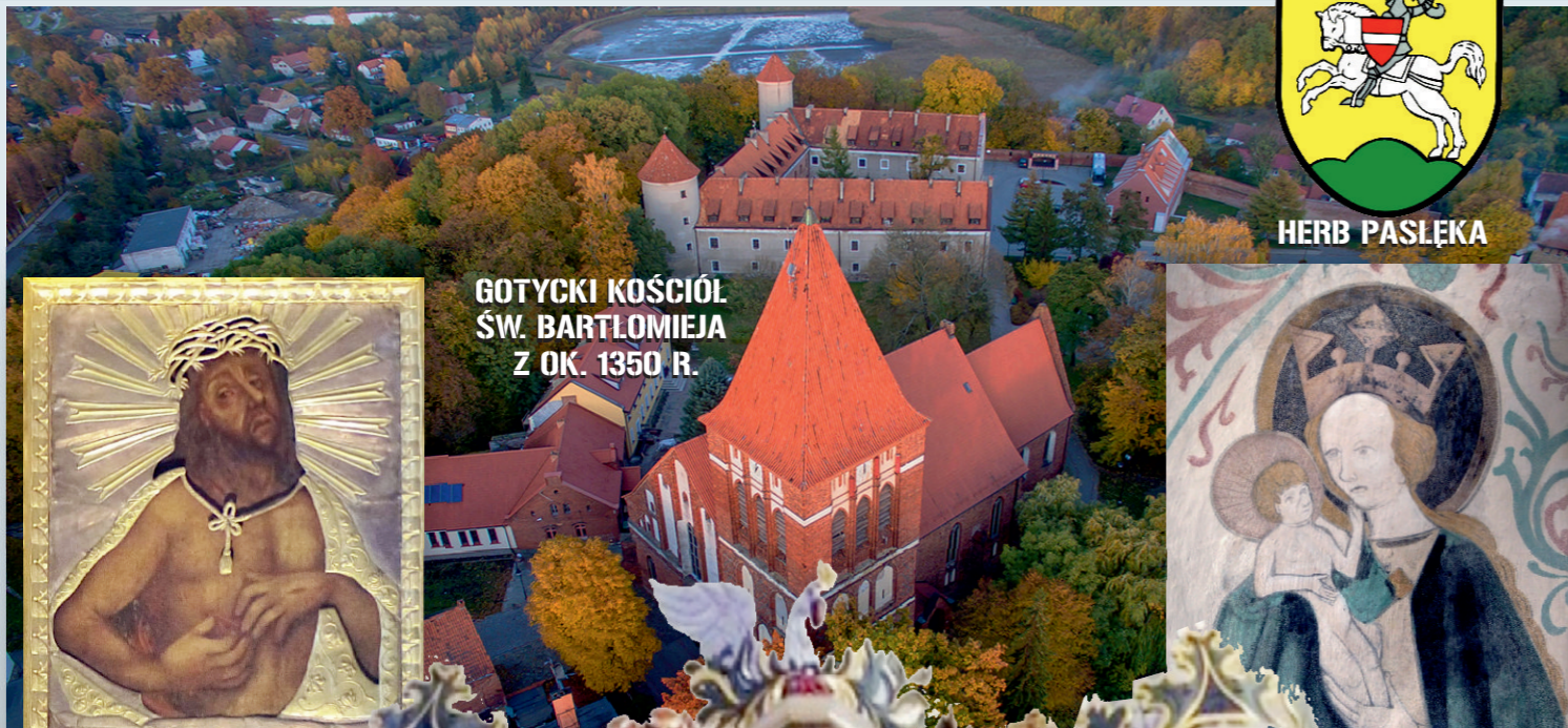
GOTYCKI KOŚCIÓŁ ŚW. BARTŁOMIEJA Z OK. 1350 R.