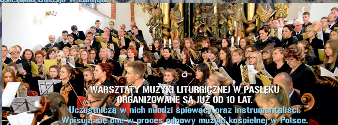
WARSZTATY MUZYKI LITURGICZNEJ W PASŁĘKU ORGANIZOWANE SĄ JUŻ OD 10 LAT. Uczestniczą w nich młodzi śpiewacy oraz instrumentalści. Wpisują się one w proces odnowy muzyki kościelnej w Polsce.