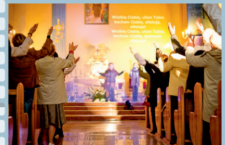
ODNOWA W DUCHU ŚWIĘTYM