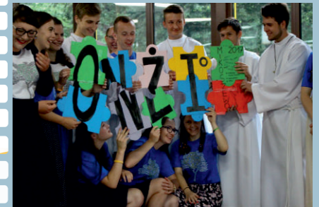
RUCH ŚWIATŁO - ŻYCIE