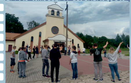
REKOLEKCJE LETNIE STAGNIEWO -BETANIA