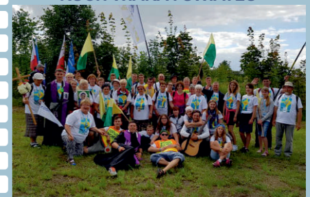
PIELGRZYMKA PIESZA NAJASNĄ GÓRĘ